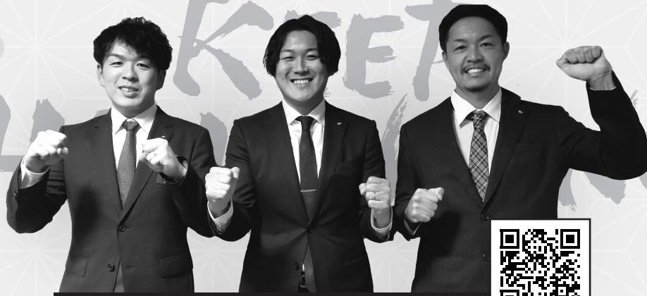
各委員長の意気込みを動画でご覧ください ▶▶